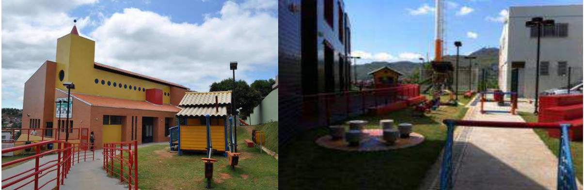
Figura 2 – Fotos de duas UMEI`s existentes em Belo Horizonte