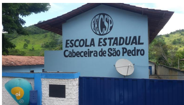
Figura 4 - Fachada da Escola Estadual da Cabeceira de São Pedro

A Escola Estadual da Cabeceira de São Pedro está localizada na zona rural de Teófilo Otoni, às margens de uma rodovia estadual. Pertence à Superintendência de Regional de Ensino (SRE) de Teófilo Otoni, sendo essa a 37ª Regional da SEE. A Figura 4 abaixo mostra a fachada da Escola Estadual da Cabeceira de São Pedro.