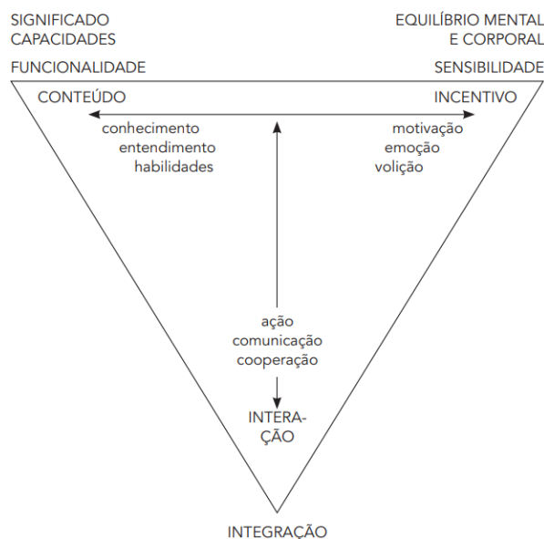
Figura 5 - As três dimensões da aprendizagem e do desenvolvimento de competências