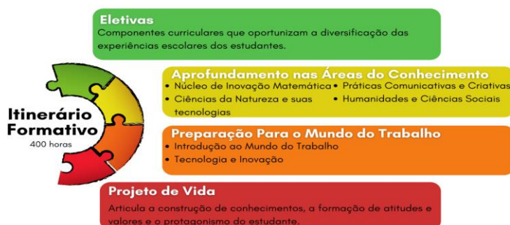
Figura 2 - Detalhamento dos Itinerários Formativos

Fonte: Retirado do Caderno Pedagógico – Itinerário Formativo (Minas Gerais, 2022)