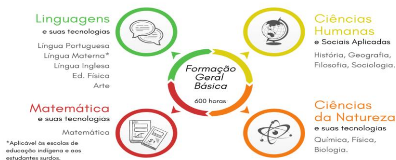
Figura 1 - Detalhamento da Formação Geral Básica (FGB)