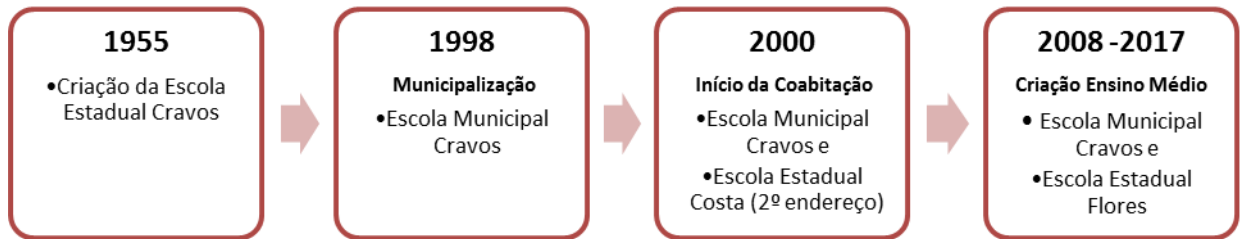
Figura 1 – Processo de instituição da coabitação (1955-2017)

Fonte: Elaborada pela autora, a partir dos registros escolares.