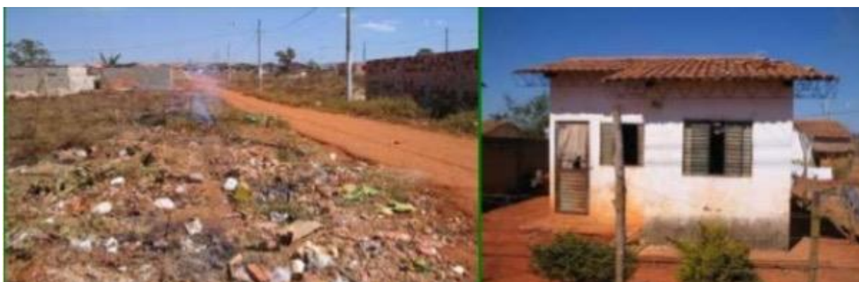
Figura 1 – Bairro Cidade de Deus