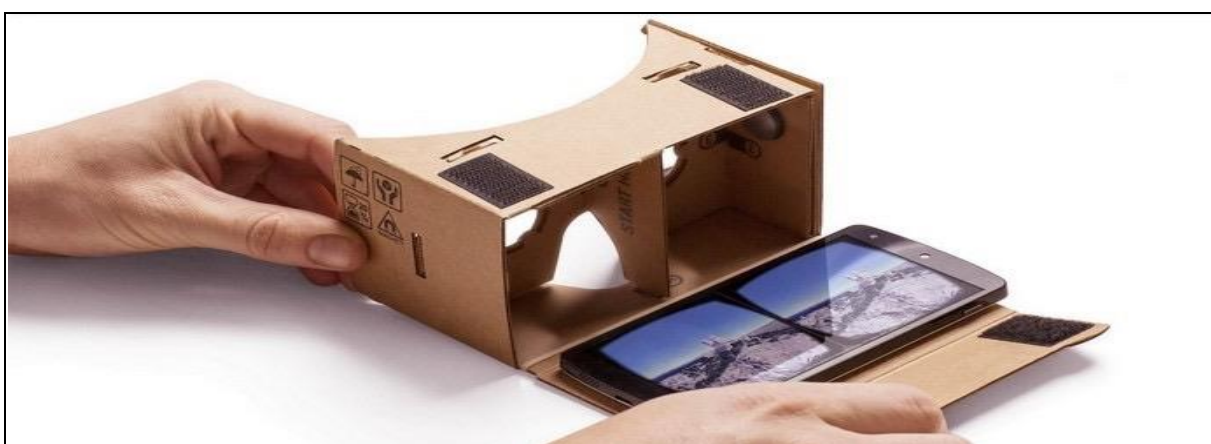
Figura 7 – Óculos de Realidade Virtual

Segundo o professor, foram feitos 40 óculos, de modo que cada aluno pudesse utilizá-los individualmente. Os óculos eram recolhidos e guardados ao final das aulas de laboratório. Para utilização da maioria dos aplicativos compatíveis com os óculos não é necessário haver conexão de internet, mas para fazer o download dos programas, sim. Alguns programas, no entanto, estão disponíveis online e exigem que os celulares possuam conexão wi-fi. Apesar disso, os alunos podem facilmente conectarem os celulares por meio do roteador existente na escola.