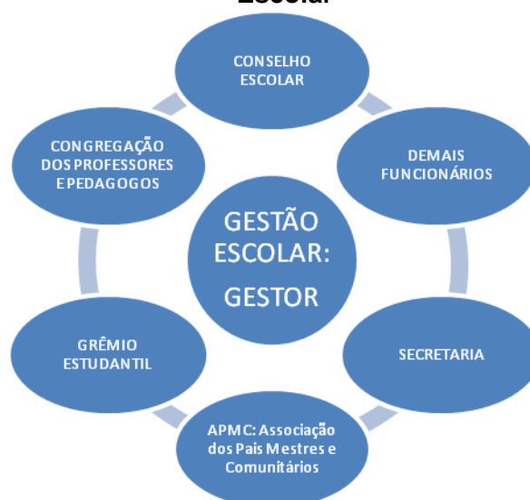
Figura 1: Rede de Comunicação entre os Representantes dos Órgãos ou Setor Escolar