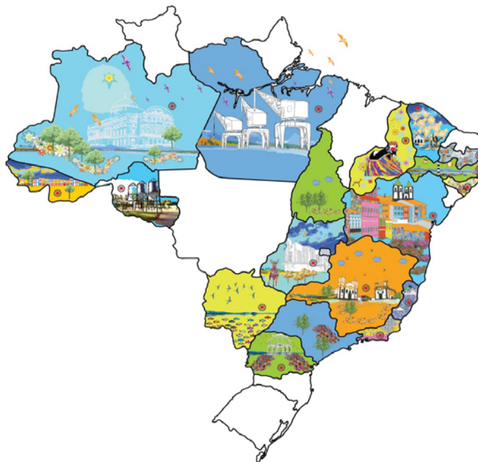
Figura 01: Estados com sistemas próprios de avaliação

No Brasil, de norte a sul, 18 estados possuem seus sistemas próprios de avaliação, como pode ser observado no mapa seguinte: